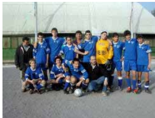
Dai Tornei: un time-out durante una partita di pallavolo e la squadra degli animatori del GREST che ha gareggiato nel torneo di calcio