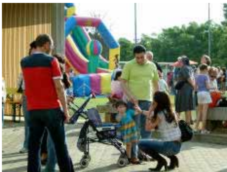
SAGRA DELLA COMUNITÀ 2006